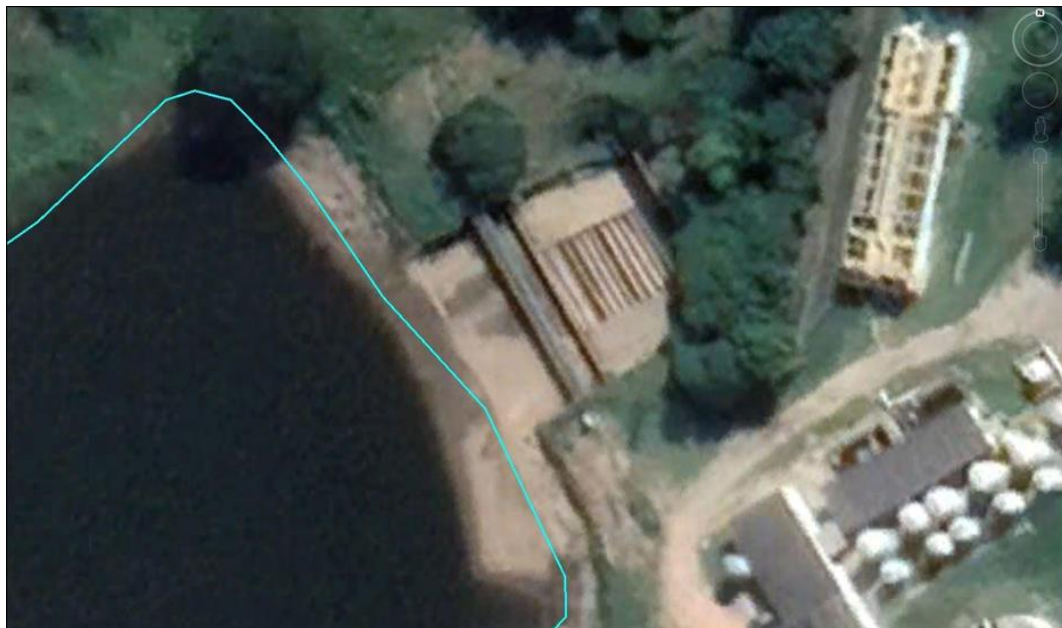
Figura 2.3 – Vista Aérea da Área da Barragem - Detalhe.

Data das Imagens: 05/01/2021.