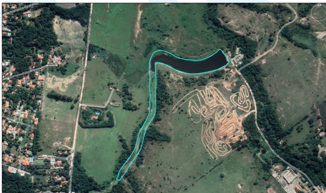
Figura 2.2 – Vista Aérea da Área da Barragem - Proximidades.

Fonte: Google Earth, Data das Imagens: 05/01/2021.